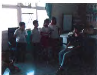
學校職員模擬演練