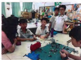
充電小站提供諮詢