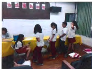
事前討論擬定訪題