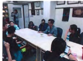
重裝上陣訪談中鋼