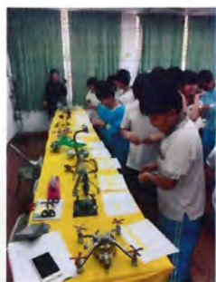
參展作品 自己決定