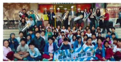
策展圓滿 自我實踐