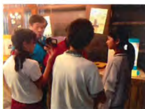
我的作品 我來解說