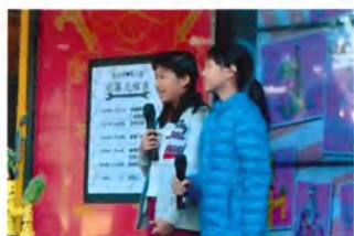
自我主持 小試身手